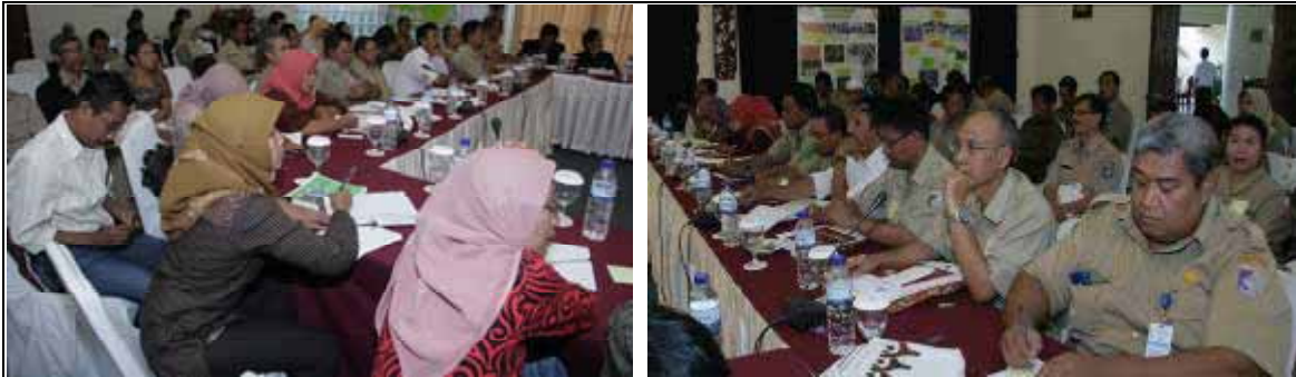
Suasana dan kondisi peserta selama proses kegiatan berlangsung