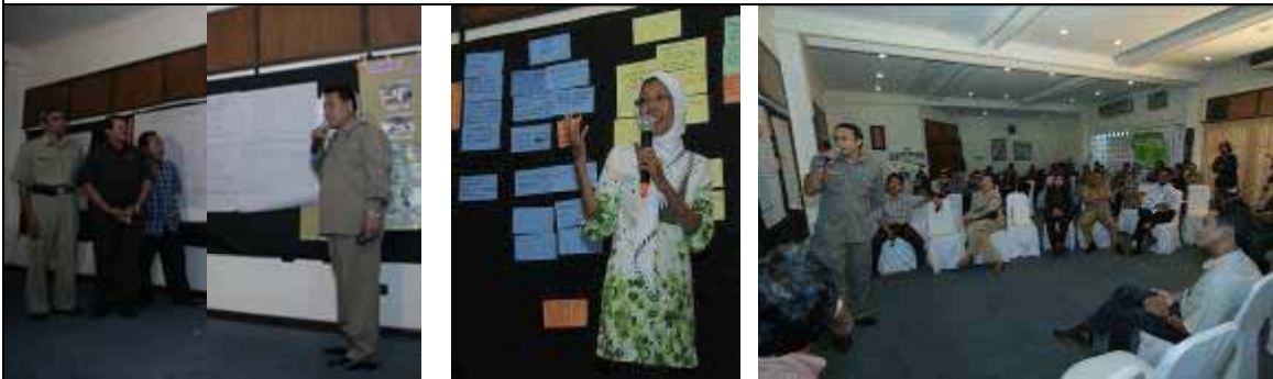
Wakil masing-masing kelompok ( Pemprop, LSM dan Pemda) sedang mempresentasi hasil diskusi kelompok