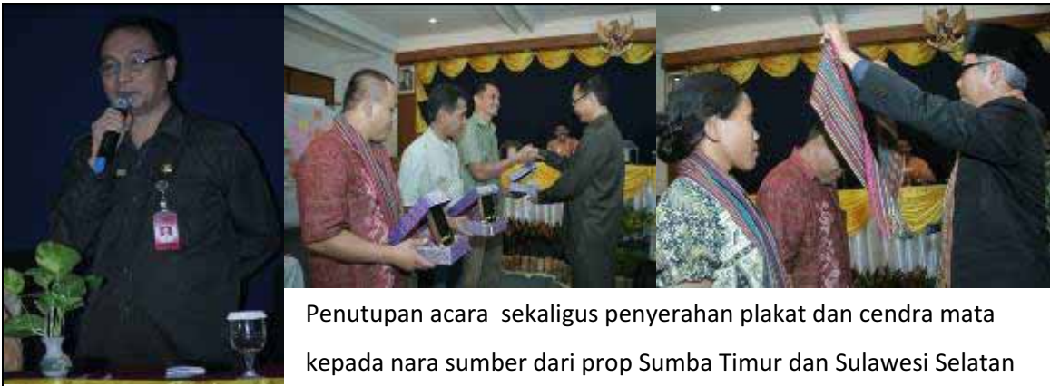
Penutupan acara sekaligus penyerahan plakat dan cendra mata kepada nara sumber dari prop Sumba Timur dan Sulawesi Selatan