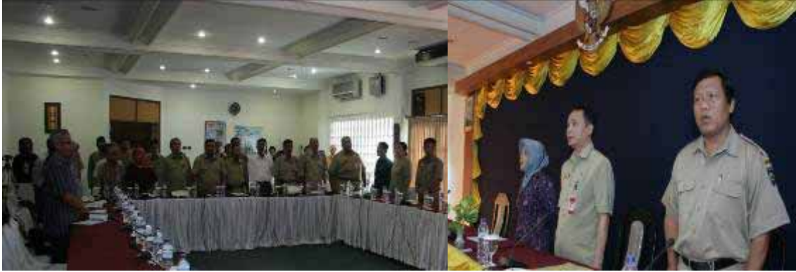
Menyanyikan Lagu Indonesia Raya, dalam rangkaian acara pembukaan